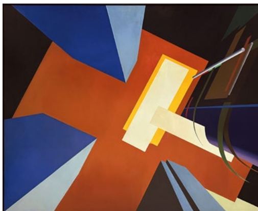
Theodor Pištěk, Dolů 2, 160 x 199,5 cm, 1996

Podařilo se nám získat dvě významná díla Theodora Pištěka (1932), momentálně nejdražšího žijícího českého malíře a zároveň jednoho z neznámějších českých umělců. Pištěk je nejen výtvarný umělec, ale také kostýmní výtvarník, scénograf a bývalý automobilový závodník. Je světově proslulým autorem filmových kostýmů a dekorací a držitelem Oscara za kostýmy k filmu Amadeus režiséra Miloše Formana. V malbě proslul zejména fotorealistickým zobrazením detailů automobilů, jejich chromovaných částí, nebo věrným zachycením běžných reálií. Neméně významná je ale i jeho tvorba inklinující ke geometrické abstrakci. V malbách prázdných schematizovaných architektur pracuje s různými druhy falešné perspektivy nebo světelného režimu. Dvě díla z tohoto období, s názvem Dolů 1 a Dolů 2, z roku 1996 se nám podařilo získat za velmi výhodnou cenu, přestože Pištěkovy obrazy jsou na trhu opravdovou vzácností.